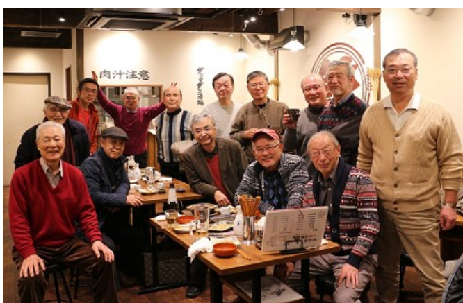
餃子屋での反省会