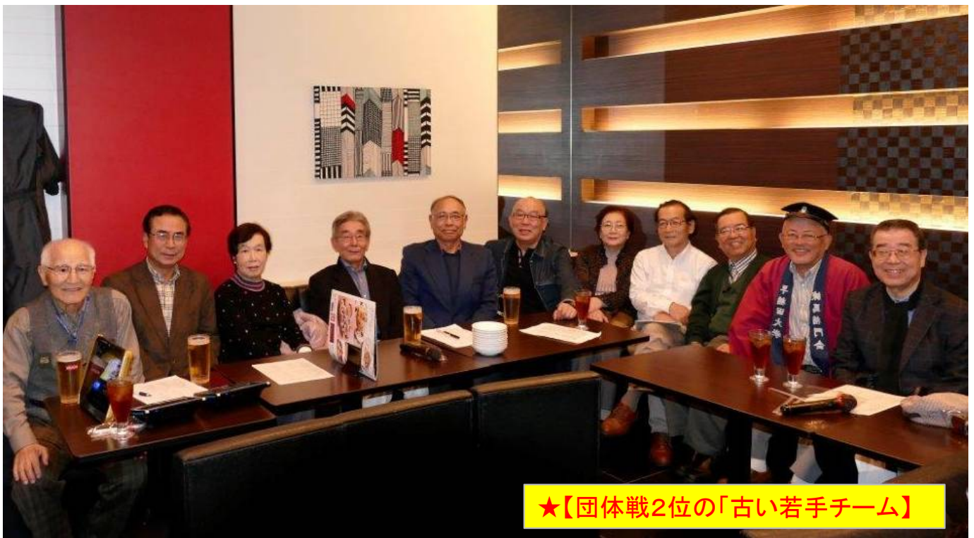
★【団体戦2位の「古い若手チーム」】