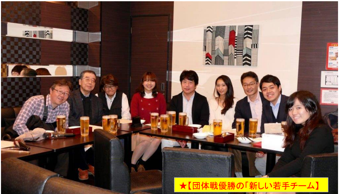
★【団体戦優勝の「新しい若手チーム」】