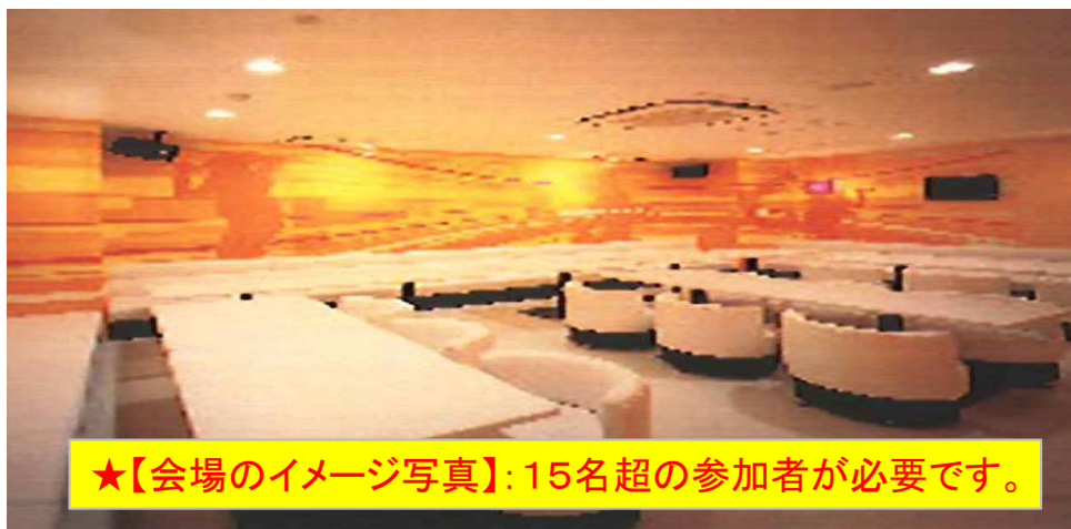
★【会場のイメージ写真】: 15名超の参加者が必要です。