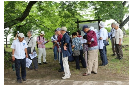
生憎、琵琶湖は、厚い雲に覆われていました。