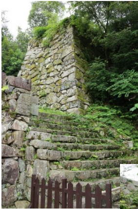
彦根城の天守は国宝です。