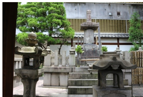
現在の本能寺にある信長の墓所