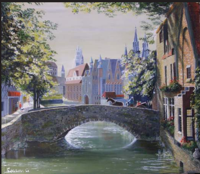
「ブリュージュの朝」(ベルギー)

西欧から東欧への旅で出会った感動を42点の細密油彩によってご紹介します。美しい田舎や、中世の街を古い資料を基に描いたものなど、どの絵も2~4か月かけて制作致しました。ご来場お待ち申し上げます。