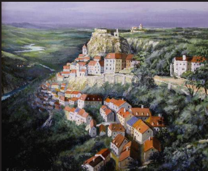
「遠い村」(フランス・ロカマドゥール)