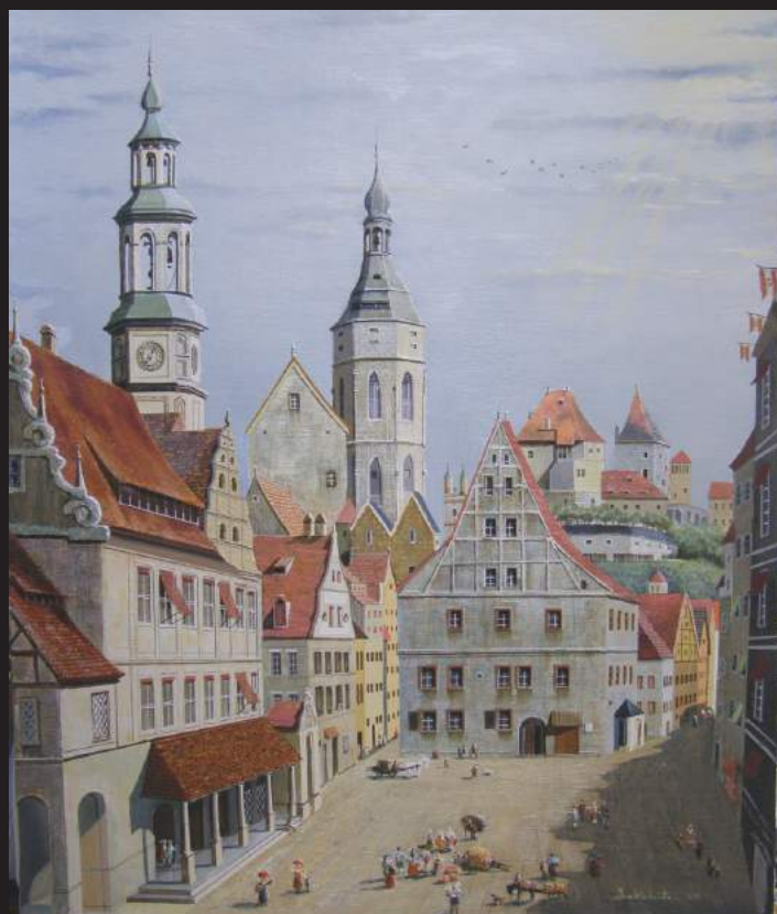
「中世のビューティッヒハイム」(ドイツ)