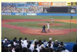
秋季早慶戦 2018. 10. 27, 8

詳細はHP ( http://nerima.waseda-info.com/ckframe.htm ) をご覧ください。