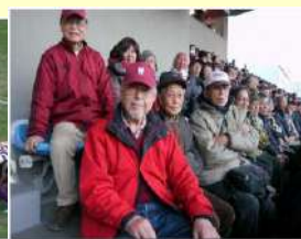
早明ラグビー2018. 12. 2

「ワセダスポーツを楽しむ会」は秋季早慶戦と早明ラグビー戦を応援に行きました。早慶戦は、早慶法三つ巴の中連勝すれば優勝という目も合った試合でしたが残念ながら1勝1敗で終わりました。参加者は延べ18名でした。一方、早明ラグビーは32名の応援の中31対27で勝ち抜き、帝京大と同率首位となり、ラグビー部創設100周年の節目に花を添える快挙で、試合後は美酒に酔いしれました。