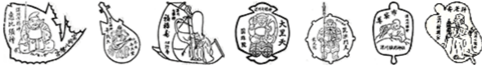
恵比須神 弁財天 福祿寿 大黒天 毘沙門天 布袋尊 寿老神